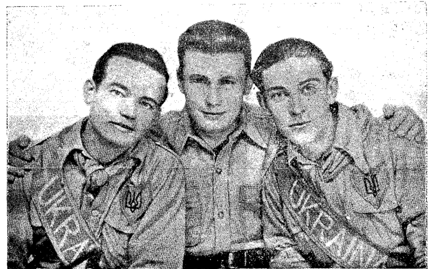
Трьох молодих українців, студентів з Праги, що минулого року вибралися у подорож довкруги світу.