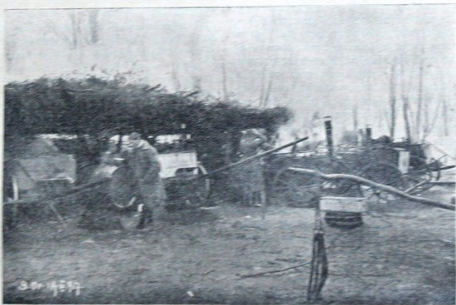
Стрілецька кухня під фронтом у Соснові в березні 1917 р.

і вигоду військової кухні. Вона і підчас походу могла варити для відділу їду. Найскорше вирішили справу німці, які вже в 1905 р. розписали кон-