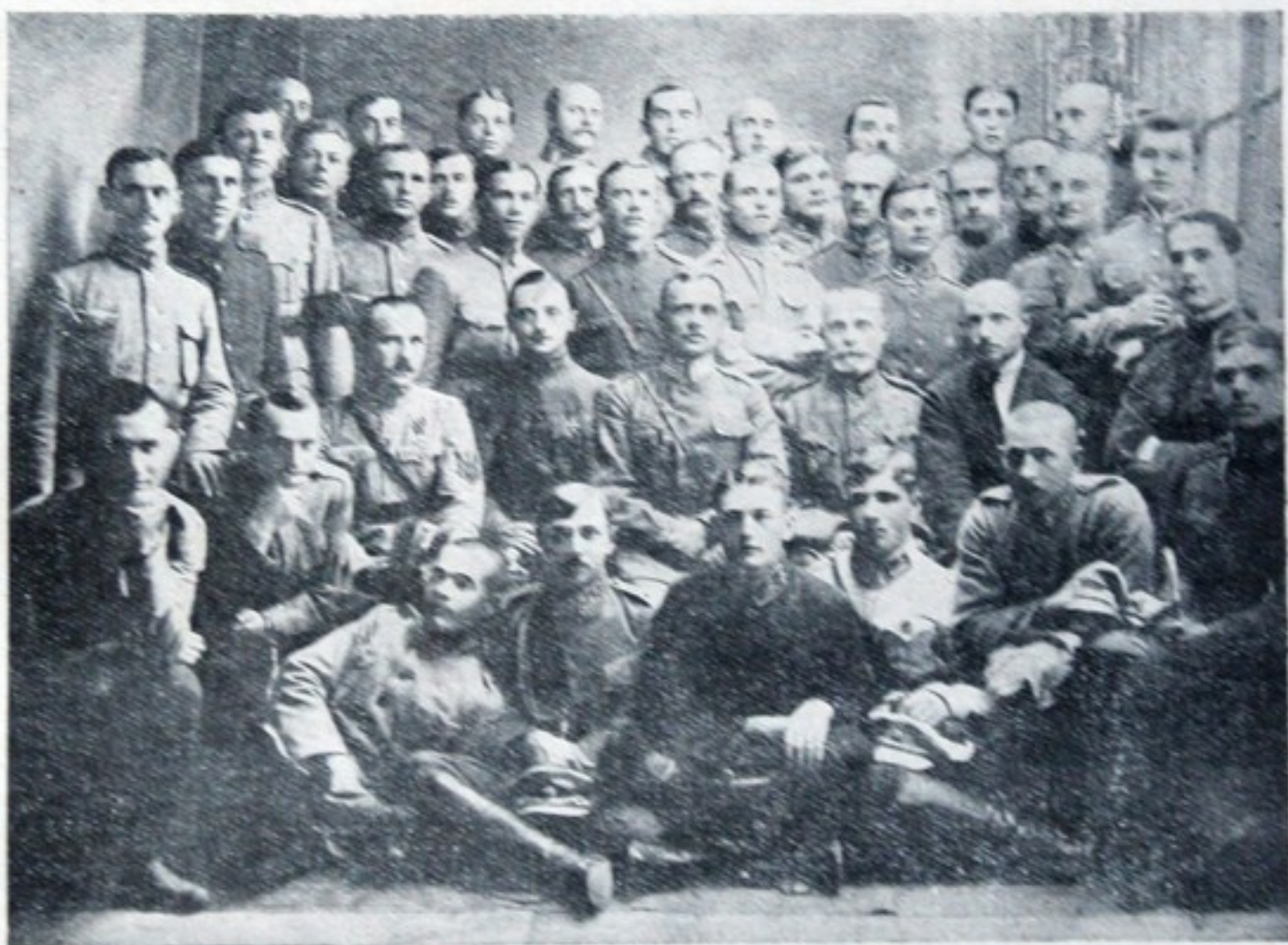
ГРУПА СТАРШИН СПІЛЬНОЇ УКРАЇНСЬКОЇ ЮНАЦЬКОЇ ШКОЛИ 1920 Р.

В жовтні 1919 р. школа урочисто зробила свій перший випуск молодих хорунжих. То були не аби-які хорунжі! Бо ж тактики, цієї основної воєнної науки — умілости вчилися не з сухих підручників, знання свої переводили не на військових „іграх“, що при всій ніби реальності показу все ж тільки „воєнною грою“ — знання свої перевіряли в обстановці правдивого сучасного маневрового бою, маючи перед собою не „означеного“ противника, якусь тим „синю“, а так-таки справжню „червону армію“ — „розігравали“ бій, почавши від висилки польової стежі та від першого далекого гарматного стрілу й перейшовши через всі стадії розвитку бою,